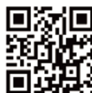
サービス施設情報

裏の路線マップを見ると、授乳室、バリアフリートイレなど、便利なサービス施設のある場所がわかります。または下のQRコードの11.888.889路線バスから詳細情報を入手してください。