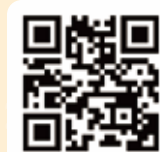
台中路線バスリアルタイム運行状況

本路線は「大雪山後門」バス停から「小雪山観光案内所」バス停の間は座席に座らなければなりません。そのため予約制になっています。14日前から予約が可能です。当日の予約はできません。予約およびインフォメーションは毎日8時から17時までとなっており、中台湾客運0800-676-676#2までお問い合わせください