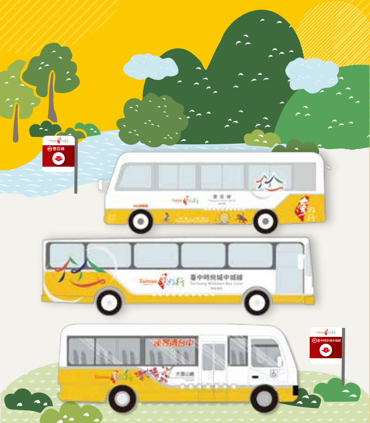
支援: 交通部觀光署 (広告)